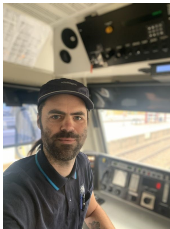
Ordförande Seko Västtåg

Det har nu blivit dags för mig att stämpla ut, parkera tåget och lämna över ordförandeklubban. Tack för allt. Håll fanan högt så ses vi därute.